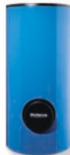
Komfortní standard: Zásobník teplé vody Logalux SM

Bivalentní zásobníky pro ohřev teplé vody lze optimálně zvolit podle požadavků. Součástí zvýhodněného balení je provedení o objemu 300 litrů se dvěma výměníky tepla z hladkých trubek. Zásobníky jsou opatřeny patentovanou sklokeramickou termoglazurou Duoclean MKT modré barvy, která vyniká vysokou odolností vůči teplotním šokům, absolutní netečností vůči vápenatým usazeninám, a spolu s magnéziovou anodou slouží jako ochrana zásobníku proti korozi.