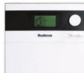
Solární regulátor Logamatic SC20

Solární regulátor Logamatic SC20 umožňuje samostatnou regulaci solárních zařízení určených k ohřevu pitné vody. Osvědčená koncepce obsluhy „Stiskni a otoč“ a přehledný podsvícený segmentový LCD displej s animovaným piktogramem umožňují snadnou obsluhu a kontrolu funkce solárního zařízení. V automatickém provozu lze zjistit celou řadu provozních hodnot solárního zařízení (teploty na kolektorovém poli a v zásobníku, provozní hodiny čerpadla, otáčky čerpadla ...). Předností regulátoru je také optimalizované řízení provozu prostřednictvím funkce Double – Macht – Flow. Tato funkce umožňuje optimalizované nabíjení zásobníku změnou otáček oběhového čerpadla v solárním okruhu.